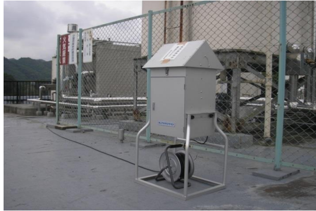
<参考写真>ハイボリウムエアサンプラー 設置状況(吉田総合支所4階屋上にて)