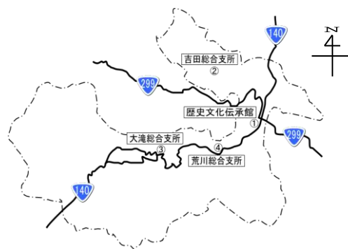
図4-1大気測定場所一覧図