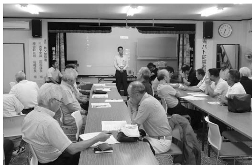
整備された公会堂の机・椅子等