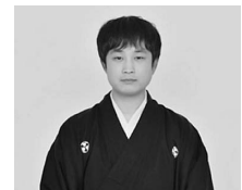
桃月庵こはく（落語）