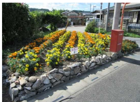
花いっぱい運動の様子