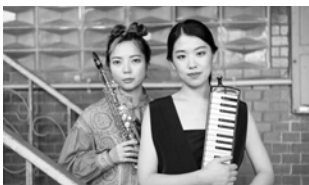
海藻姉妹 ©石田宗一郎