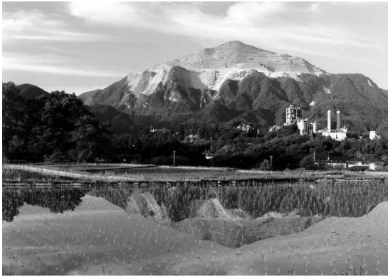
「第5回写真コンテスト 入選作品」