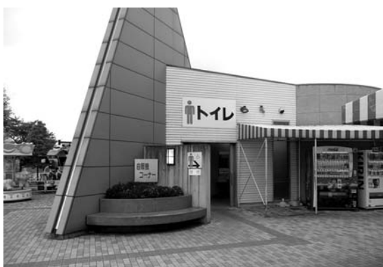
洋式化90%の道の駅のトイレ

答 市内の学校では、小学校では2時間54分、中学校で3時間12分という回答があり埼玉県と同様の結果である。今学期中に、出勤と退勤の時刻をICカードリーダーを使って記録できるシステムを導入し、教員の時間外勤務に対して、多忙化解消・負担軽減に向け取り組んでいく。