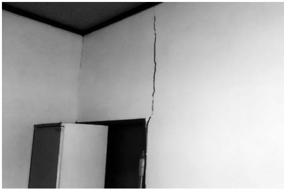
家屋内のひび割れ

答 この事象については、明確な 原因が解明されていないため、発 行できるかどうか研究する。