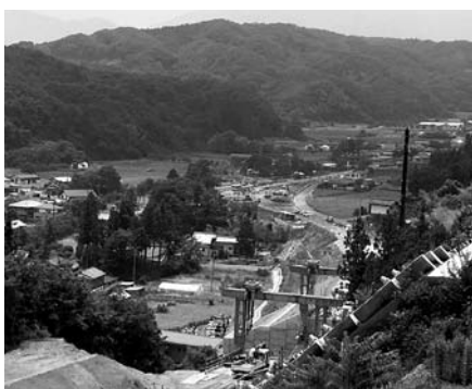
急ピッチで工事が進む140号バイパス上蔭田交差点

答 満足度を向上させるため重点的に事業を展開しなければならぬことに加え、取り組みや成果の市民への周知活動に努める。