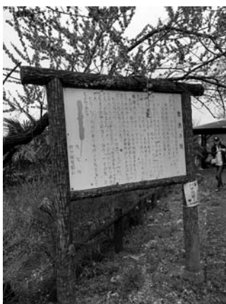
観光地域づくりには案内板の点検・整備が重要

答 ぜひ取り組んでいかなければならない。わかる授業を通していきいきとした学校とし、児童生徒の問題行動を未然に防止することは生徒指導の考え方としても非常に合致したものであると考える。