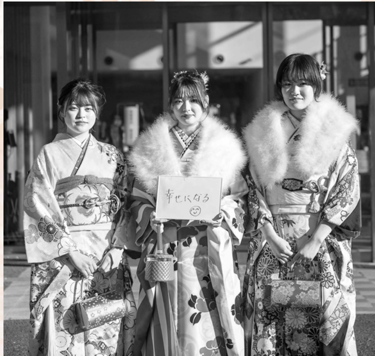
わたしたちの将来の夢！（裏表紙にも掲載）