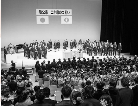
4年ぶりの「旅立ちの日に」全員合唱